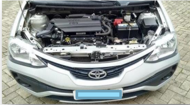
Foto do Cofre do Motor, com registro da placa dianteira na mesma foto, evidenciando as partes externas do motor, (bateria, filtro de ar, coletores), reservatórios (aditivo radiador) e vareta de óleo (óleo lubrificante sem contaminação).