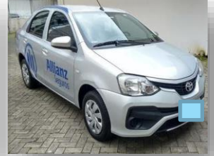
Foto panorâmica da dianteira e traseira do veículo, com capô e porta mala fechados.